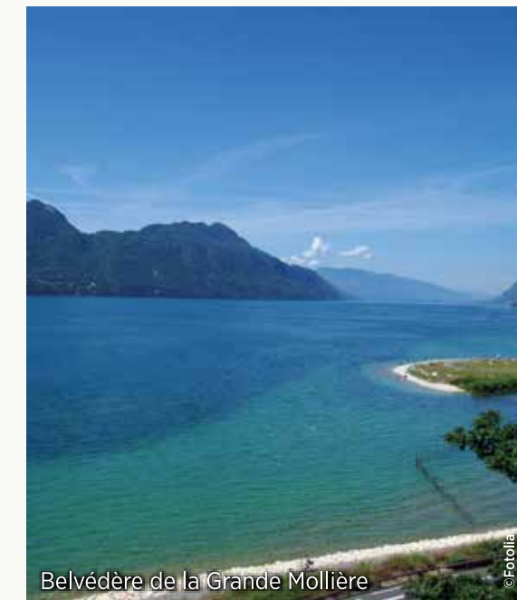
Belvédère de la Grande Mollière