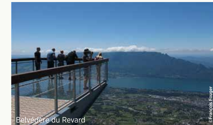
Belvédère du Revard