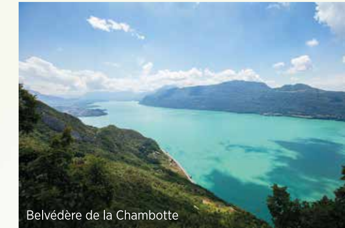
Belvédère de la Chambotte

Plongez à la découverte de notre environnement préservé, de nos savoir-faire, nos richesses et partez à la rencontre d'artisans passionnés par leur métier.